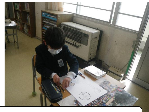
カルタ作りの様子です