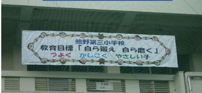
学校教育目標の横断幕作成