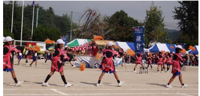
法被のクリーニング